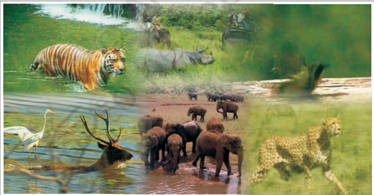
चित्र 8.3 : वन्य जीवन

वनों के कटने तथा जानवरों के शिकार के कारण भारत में पाए जाने वाले वन्यजीवों की प्रजातियाँ तेज़ी से घट रही हैं। बहुत सी प्रजातियाँ तो समाप्त भी हो चुकी हैं। उनको बचाने के लिए बहुत से नेशनल पार्क, पशुविहार तथा जीवमंडल आरक्षित क्षेत्र स्थापित किए गए हैं। सरकार ने हाथियों तथा बाघों को बचाने के लिए बाघ परियोजना एवं हस्ति परियोजना जैसी परियोजनाओं को शुरू किया है। क्या आप भारत के कुछ पशुविहारों के नाम तथा मानचित्र पर उनकी स्थिति बता सकते हैं?