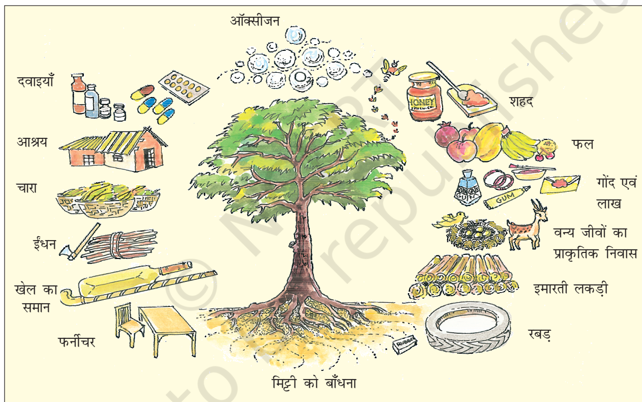
चित्र 8.2 : वनों के उपयोग