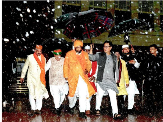
Next move: Union Minister Kiren Rijju with a delegation of Muslim clerics for a meeting on the Waqf (Amendment) Bill, 2024 in New Delhi, on August 9, 2024

The Waqf Board is authorised to manage waqf properties and take measures to recover lost assets. It can also sanction the transfer of immovable waqf property through sale, gift, mortgage,