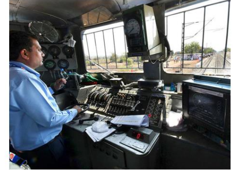
Safe and sound: The protection system alerts the pilot to red signals and applies automatic brakes if necessary.

Total coverage of Indian Railways is more than 68,000 rkm and Kavach coverage 1,465 rkm