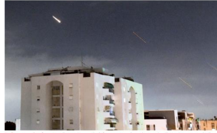
Defence mechanisms: Israel's Iron Dome air defence system launches projectiles to intercept missiles fired from Iran, in central Israel, on April 14, 2024.