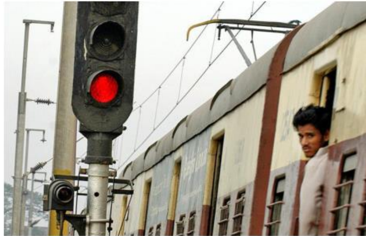
Safe journey: The Railways aims at improving the reliability and maintainability of the signalling systems. V. GANESAN

By rolling out a “Plan for Reliability Improvement and Maintenance Effectiveness (PRIME)”, the Rail-