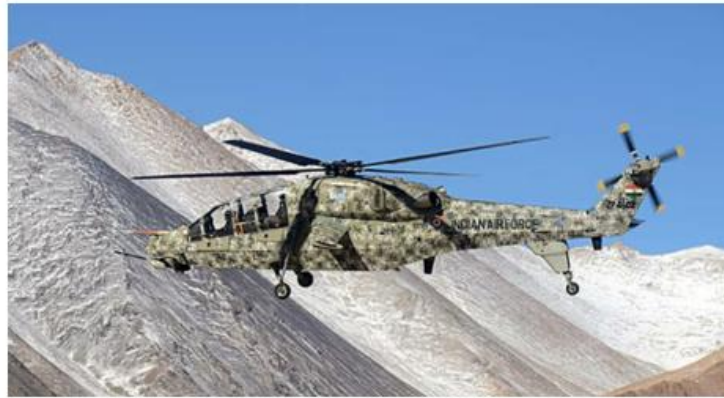
The light combat helicopter is specifically designed for high-altitude conditions, while the Apache is meant for deserts.

“The manufacturer has communicated that there have been manufacturing delays due to supply chain issues. The first batch of three Apaches is now set to be delivered in December and the next three a few months after that,” a defence source said. As per the original schedule, three helicopters were sup-