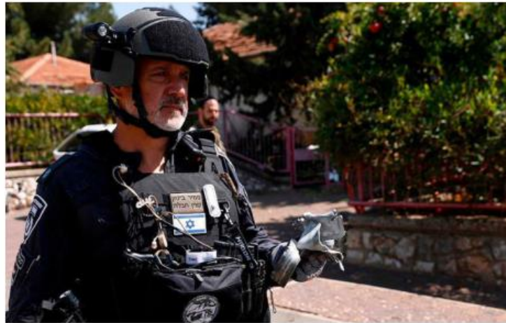
Proof of strike: An Israeli official holding the remnants of a rocket at the site of a strike, fired from Lebanon, in the city of Safed.

The Israeli military said it intercepted the surface-to-surface missile, which set off air-raid sirens in Tel Aviv and across central Israel. There were no reports of casualties or damage. The military said it struck