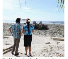
World Bank president Ajay Banga views the impact of sea level rise in Funafuti, Tuvalu.