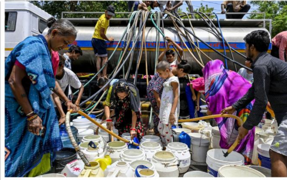
Blazing heat: Residents collect drinking water from a tanker amid a water crisis in Delhi, on a hot summer day in New Delhi on June 6.

Predictions may pose challenges A quote often attributed to physicist Niels Bohr is apt here: prediction is difficult,