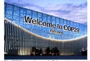
The COP29 summit venue in Baku.