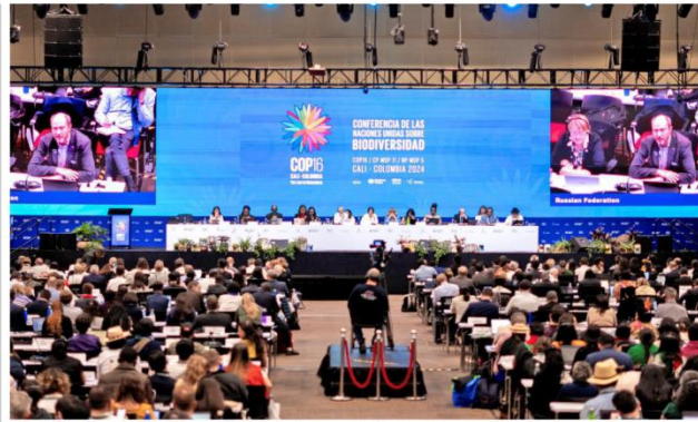
A view of the closing session at the COP16 summit in Cali, Colombia, November 1, 2024.

Momentum for blue: Negotiators also agreed to a new and upgraded process to identify ‘Ecologically or Biologically