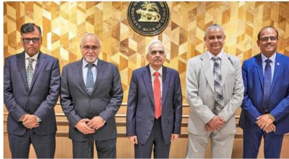
Not on the table: De-dollarisation is certainly not our objective. It is not on the table at all, says Das.

"The BRICS currency was an idea raised by one of the members of the BRICS countries and it was discussed," Mr. Das said. "No decision has been taken in the matter. The geographical spread of the countries is a factor which