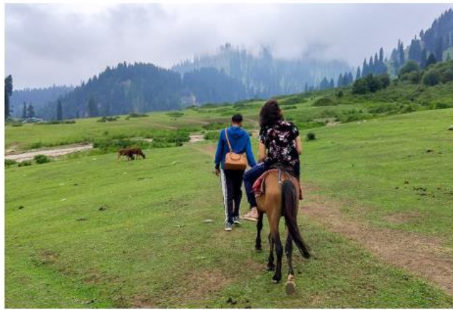
Hidden spots: A tourist taking a pony ride to reach Shaliganga river in Doodhpathri in Budgam district.

and Katra Vaishno Devi and are some of the famous tourist destinations in Jammu and Kashmir at present. According to official estimates, Jammu and Kashmir recorded 1.2 million tourists arrivals in the first half of 2024.