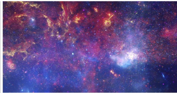
Cosmic puzzle: This composite image pieced together by data from multiple telescopes shows a part of the Milky Way galaxy's central region. The bright white portion hosts a supermassive black hole as well as energetic particle reactions that produce antimatter.

Look at the world in a mirror. Does it look the same? Apples would still fall and moons would circle planets because gravity would be unchanged. Protons and neutrons would cling to form nuclei