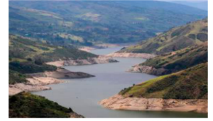
More than three-quarters of the world's land experienced drier conditions from 1970 to 2020 than the previous thirty-year period