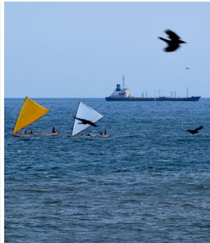
Quick change: Catamaran boats pass by a merchant navy ship anchored off Visakhapatnam.

India is the second largest ship recycling centre after Bangladesh, and the ship recycling industry practices the concept of cash purchase of the vessel before it is brought for demolition. Often