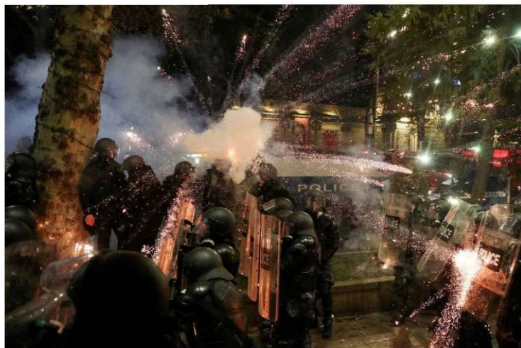
On the boil: A firework explodes near police officers during a rally of Opposition parties' supporters in Tbilisi, Georgia, on November 30.

down on the protestors has also triggered outrage at home and condemnation abroad.