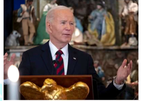
The anti-Islamophobia plan release comes five weeks before U.S. President Joe Biden leaves office. AP