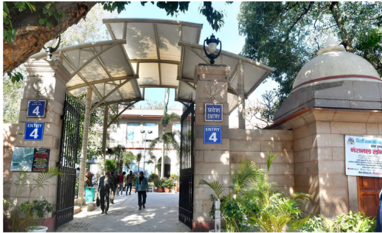
Parliamentary Complex in New Delhi, India, viewed from the street.