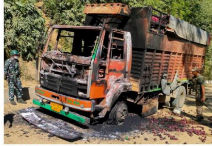
Tension rises: A truck damaged after armed militants set it on fire in Jiribam district on Thursday.

A senior government official explained that the Army and the Assam Rifles would be able to conduct operations without waiting for the arrival of a Magistrate and the State police.