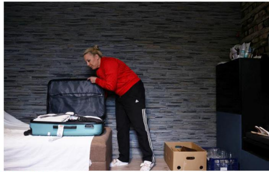
Desperate move: The Portuguese government is offering tax exemptions as high as 100%.

He is doubtful the government's new measures will be enough.