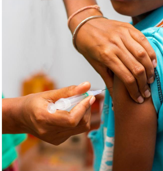
Insulin is not a cure but a treatment, allowing people with diabetes to live near-normal lives.

Climax at the University of Toronto After serving as an orthopaedic surgeon in the First World War, Frederick Banting returned to Canada as a war veteran. Driven to pursue research, he approached John Macleod, head of the physiology department at the University of Toronto, in 1920, with the idea of identifying the pancreatic secretion responsible for carbohydrate metabolism. Macleod, though hesitant, provided laboratory space and assigned Charles Best, a medical student, to assist him. Together, Banting and Best conducted experiments on dogs, leading to the successful isolation of insulin from the islets of Langerhans.