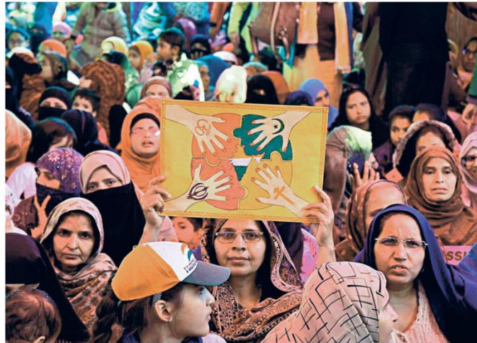
Nation For all: A woman holds up a poster during a protest against the CAA during Republic Day at Shaheen Bagh, in New Delhi in 2020. SUSHIL KUMAR VERMA

The preservation of diversity is the rationale behind minority rights in the Indian Constitution. In fact, individualistic rights under Articles 14-18 (equality), 19 (free speech) and 25 (freedom of religion) are not enough for