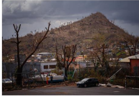
Tempest effect: Pamandzi region in Mayotte on Tuesday after the French island territory was hit by Cyclone Chido.

"Mayotte is totally devastated," French Interior Minister Bruno Retailleau said, with the ministry esti-