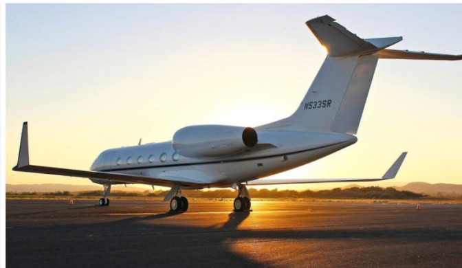
As of March 2024, 112 private planes were registered in India. Representative photo. CHRIS LEIPOLD

These events were the World Economic Forum in Switzerland; the Super Bowl in the U.S.; the COP28 climate talks in the U.A.E.; the Cannes Film Festival in