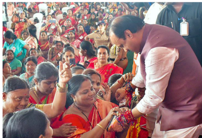
At a 'Mukhyamantri Majhi Ladki Bahin' scheme event, in Solapur, Maharashtra.

There's a related question - how much do such promises – mixer-grinder or cash transfers, actually influence voter behaviour? I don't know