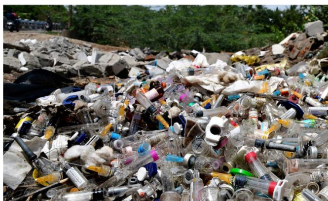
Silent hazard: Alleged medical waste found near Coimbatore Corporation limits. FILE PHOTO

The Act marked a turning point, shaping public health policies and environmental safety norms in the years to come. This legislation introduced stringent regulations for the handling, transporting, and disposing of medical waste, forever changing the healthcare