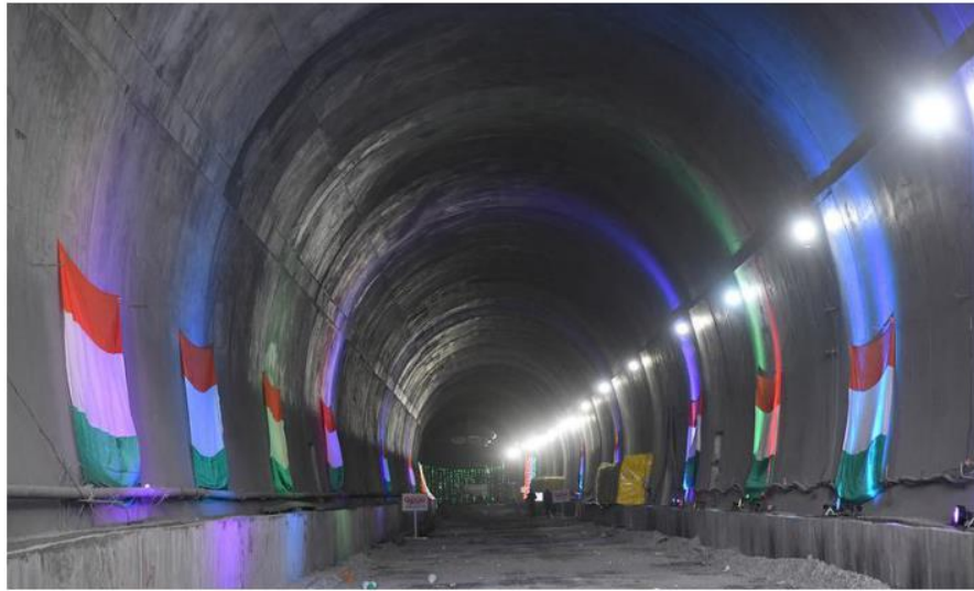
A view of the Z-Morh tunnel that connects Gagangir and Sonamarg.

Hoteliers are enthusiastic about the tunnel. "It was much needed to have Sonamarg on the winter tourism map of Kashmir.