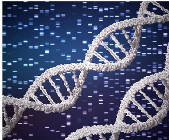
A major focus of the Indian reference genomes is to have researchers study diseases.

A first analysis of the genomes estimates around 27 million low-frequency (or relatively rare) variants, with 7 million of them not found in similar reference databases around the world. Certain population groups show higher frequencies of alleles, or different versions of the same gene. Over the last two de-