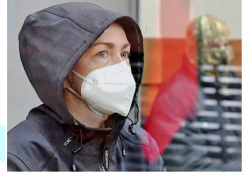
Radio Free Europe-Radio Liberty editor Alsu Kurmasheva sits in a courtroom in Kazan, Russia. FILE PHOTO