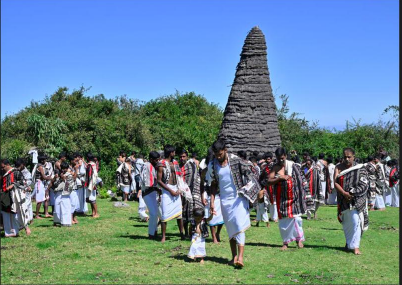
Revelry time: Members of the Toda tribe in the Nilgiris gather around a 'moonbo' (head) temple in the Muthanad 'mund' (hamlet) in Udhagamandalam on Sunday to celebrate the Modwerth festival and discuss plans for the year

नीलगिरी में टोडा जनजाति सांस्कृतिक एकता को बढ़ावा देने और उधगमंडलम में समुदाय की प्रगति की योजना बनाने के लिए मोडवर्थ त्योहार मनाती है।