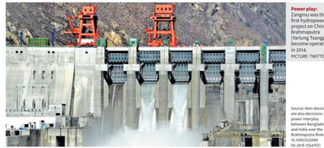
Power play: Zangmu was the first hydropower project on China's Brahmaputra (Yarlung Tsangpo) to become operational, in 2014.