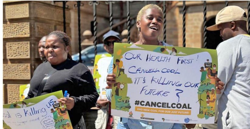
Cancel Coal protests in South Africa. GROUNDWORK

In July 2024, the country's President Cyril Ramaphosa signed the Climate Change Act into law, which includes a clause to reduce greenhouse gas