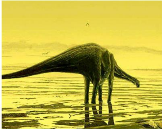
An artist's impression of sauropod dinosaurs on the Isle of Skye in this undated handout photo provided by the University of Edinburgh, December 2015. REUTERS

The team found five trackways — or series of footprints — in all. They said