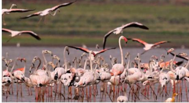
Winged visitors: A similar flamingo festival was conducted at Sullurpeta in 2020. NAGARA GOPAL

be spread across five locations including Nelapattu, B.V. Palem, Atakanithippa, Sri City and Sullurpeta. According to Tirupati district Collector S. Venkateswar, a three-day session will be conducted on eco-friendly biodiversity at Sri City, bird