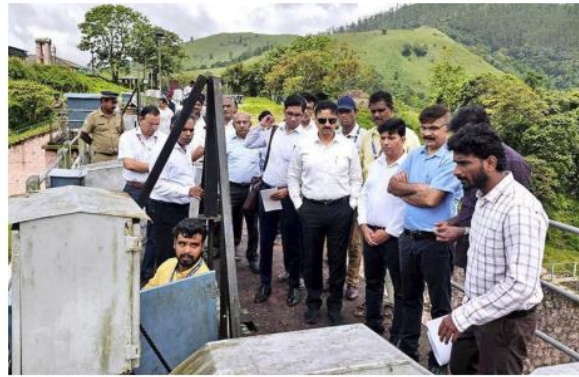
Safety check: Supreme Court-appointed monitoring committee members inspect Mullaperiyar dam in Kerala, on June 13, 2024.

A three-judge Bench headed by Justice Surya Kant said the Dam Safety Act, 2021, was "existing on paper" after the State of Kerala argued that "nothing has been done", including the constitution of a National Committee on Dam Safety. "Despite Par-