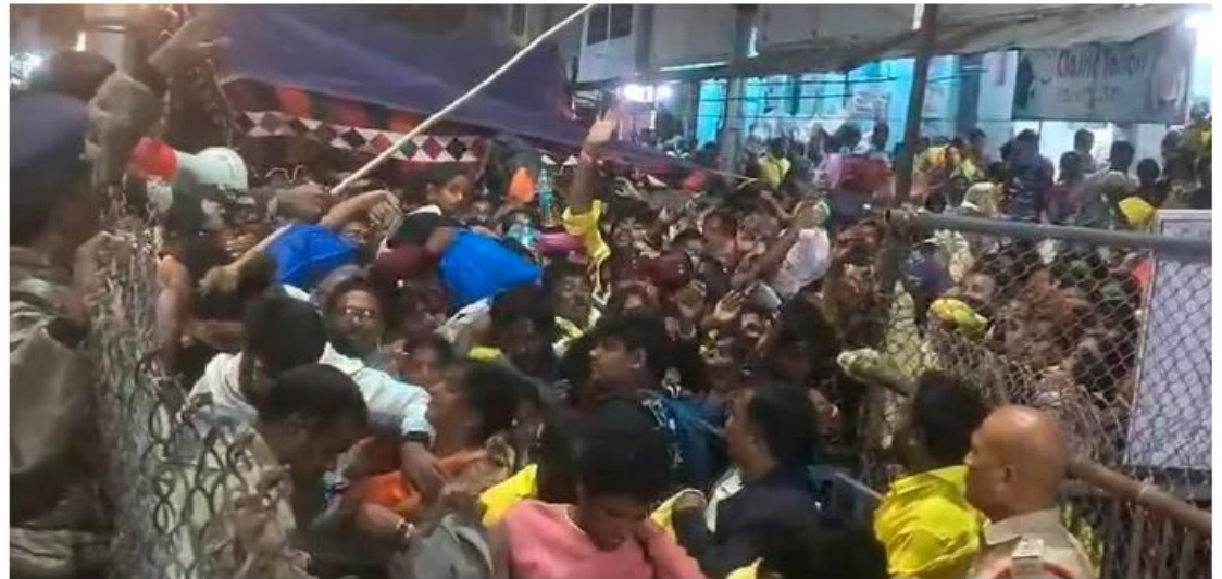
Rush for darshan: People gathered near a ticket counter at Vishnu Nivasam, Tirupati on Wednesday.

whelming crowd at the counters, including Vishnu Nivasam, Bairagipatteda, and Ramachandra Pushkarini, led to chaos as the arrangements were reportedly not adequate. The police had a tough time controlling the crowd.