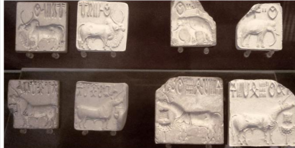
Decoding language: Seals with the script of the Indus Valley Civilisation.

"The IVC 'is non-Aryan and pre-Aryan,'" argued Mahadevan in his article published in The Hindu on May 3, 2009. Attributing "solid archaeological and linguistic evidence," the scholar, who passed away in 2018, emphasised that "the Indus script is a writing system encoding the language of the region (most probably Dravidian)". Ruling out Aryan authorship of the civilisation, he hastened to add that this did not automatically make it Dravidian. Yet, "there is substantial linguistic evidence favouring the Dravidian theory: the survival of Brahui, a Dravidian language in the Indus region; the presence of Dravidian