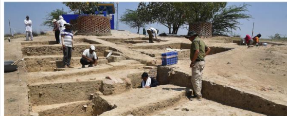
Buried secrets: Different structures are exposed in a trench at Rakigharhi, a Harappan site in Haryana, in 2022. SHEV KUMAR PUSHPAKAR

loanwords in the Rigveda; the substratum influence of Dravidian on the Prakrit dialects; and computer analysis of the Indus texts revealing that the language had only suffixes (like Dravidian), and no prefixes (as in Indo-Aryan) or infixes (as in Munda)," Mahadevan wrote. As the Dravidian models of decipherment had still little in common except certain basic features, "it is obvious that much more work remains to be done before a generally acceptable solution emerges," according to him.