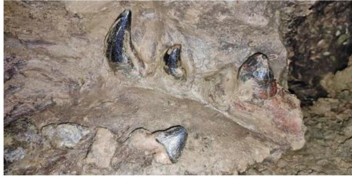
The fossil was cut and removed from a cave.

"It is unfortunate that this has happened. The police are conducting an inquiry and we hope the piece of the fossil, a significant palaeontological discovery, is retrieved soon," the Chief Minister said, admitting that the govern-