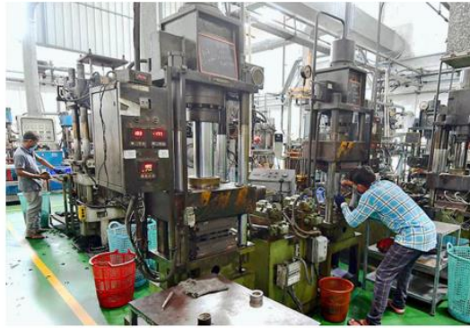
The Survey notes that MSMEs employ 23.24 crore people at relatively low capital costs, second only to agriculture.

Yet, there is an "observed tendency for firms in India to remain small". So, they lose access to institutional capital, skilled talent, and technology infusion and often operate outside the formal supply chains. This creates a parallel, informal economy and contributes to low labour productivity, the Survey noted.