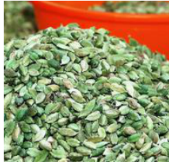
A view of dried green cardamom in Kerala's Idukki district.

An international team of researchers have identified six species that are close cousins to Elettaria cardamomum , better known as green cardamom. Of the six, four were previously placed in a separate genus, Alpinia , while the remaining two have been newly identified and described