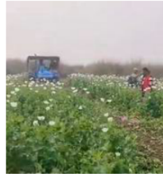
Poppy plantations being destroyed in Assam.

Taking to social media platform X, Chief Minister Himanta Biswa Sarma equated the local poppy cultivators with Pablo Escobar, a Colombian drug lord who was killed in 1993. "Dear Local Pablo Escobars, sorry to spoil your planned Uda Assam party! Because @Goalpara_Police destroyed 170 Bighas of poppy cultivation in the Char (sandbar) areas worth ₹27.20 crore in January. So next time you think of drugs, think of @assam-police first," he wrote. Manipur Chief Minister Nong-