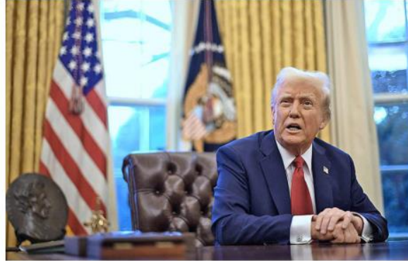
The U.S. President also suspended exemptions allowing low-value imports from the three countries to enter the U.S. duty-free.

Mr. Trump said on Sunday that Americans may feel economic "pain" from his tariffs on key trading partners, but argued it would be "worth the price" to secure U.S. interests. "Will there be some pain? Yes, maybe (and maybe not!)" Trump wrote Sunday morning in all-caps on his Truth Social media