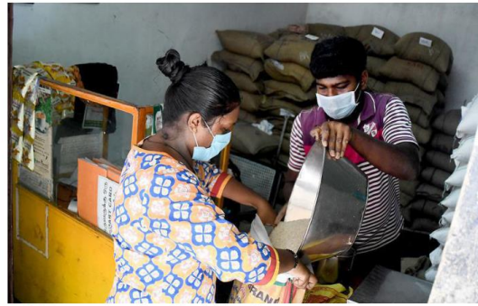
Hard hit: Women's share in the workforce fell due to their over-representation in certain sectors.

After countries borrowed money to protect welfare and livelihoods, global government debt has risen by 12 percentage points since 2020, with steeper increases seen in emerging markets. The pandemic sparked high levels of inflation, which proved to be a major concern in the 2024 U.S. elections. Fuelled by post-lockdown spending, government stimulus packages and shortages of labour and raw materials, inflation peaked in many countries in 2022.