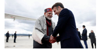
Warm greetings: Prime Minister Narendra Modi with French President Emmanuel Macron in Marseille on Wednesday.