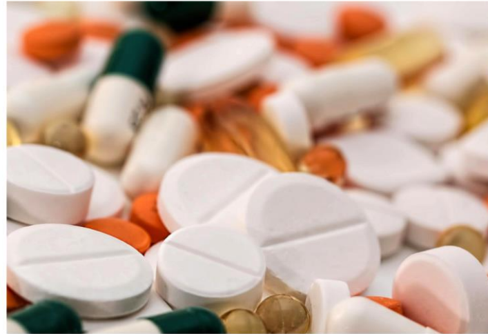
The responses of humans belonging to different populations around the world to drugs and diseases vary in ways that can't be captured in the responses of a homogenous, lab-bred animal population. FIXBAR

Another pain point in drug development that AI could surmount is predicting whether a drug could have unintended effects. In December 2024,