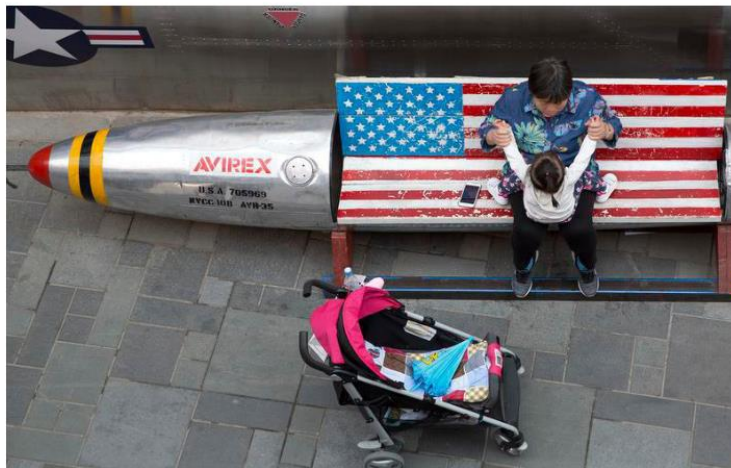
Nuclear option: The U.S. deterring overseas investment could devastate a frothy market.

Trump's economic weapon of choice during his first month back in office, are one way to push back against this perceived global slight against American workers. But there's an obvious flip-side to this view.