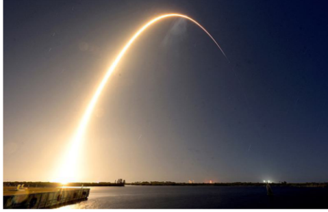
Losing fans: The moon rocket project has been criticised as an overpriced vestige of outdated rocket technology.

which is being developed by Boeing and Northrop Grumman, could offer a boost to Musk's SpaceX, which is developing its own cheaper, albeit less powerful rocket called Falcon Heavy.