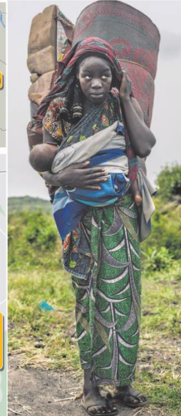
Effects of war: A displaced woman walks back to her home village, in Goma, Democratic Republic of Congo, on February 12. GETTY IMAGES

Sources: Associated Press, Institute for the Study of War, Reuters