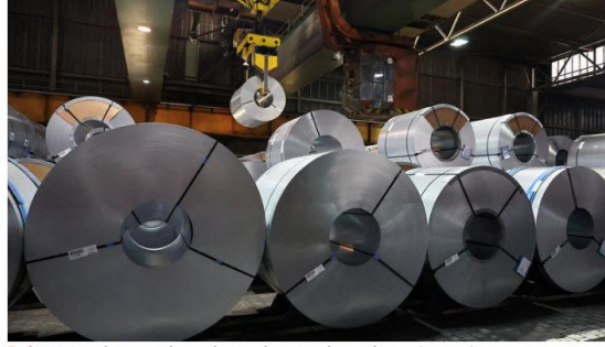
Red tape: Lengthy approval procedures and paperwork are a drag on Germany's economy.

When Russia discontinued the flow, prices in Germany skyrocketed for gas and for electricity generated from gas, both key costs for energy-intensive industries such as steel, fertilizer, chemicals and glass. Germany had to turn to liquefied natural gas, or LNG, super-cooled and imported by ship from Qatar