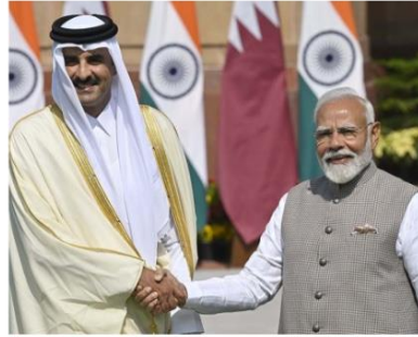
Warmer ties: Narendra Modi with the Emir of Qatar, Sheikh Tamim Bin Hamad Al-Thani, in New Delhi on Tuesday.

The Indian side also said that the strategic partnership would have a security component, though a clear timeline for such a process