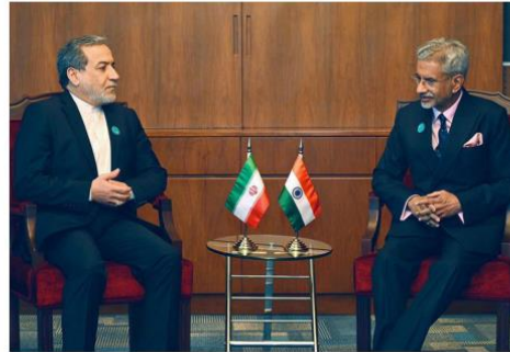
Way forward: External Affairs Minister S Jaishankar with Iranian Foreign Minister Abbas Araghchi in Muscat on Sunday.

Her family launched an international campaign for clemency for Ms. Priya,