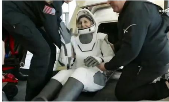
Back to base: Sunita Williams being helped out of a capsule after it landed off the Florida coast in U.S. on Wednesday.

A SpaceX Crew Dragon spaceship carrying Butch Wilmore and Sunita Williams – alongside fellow American Nick Hague and Russian cosmonaut Aleksandr Gorbunov – streaked through the atmosphere before deploying parachutes for a gentle splashdown off the Florida coast at 3.27 a.m. IST. Ground teams erupted in cheers as the spacecraft named Freedom, charred from withstanding scorching temperatures of 2,000 degrees Celsius during re-