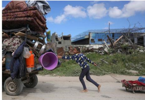
Fleeing danger: Palestinians leave Beit Hanun, heading towards Gaza City following Israeli evacuation orders on Wednesday.

Since the October 7 attacks and Israel's bombard-