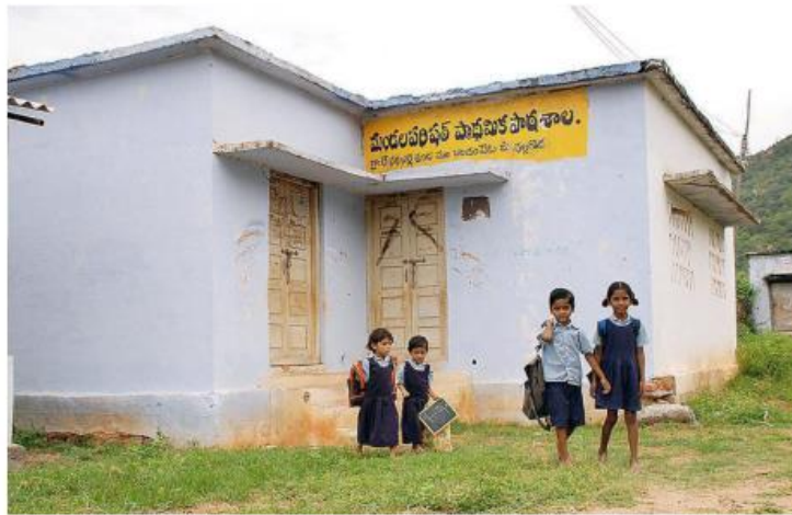
The panel also pointed out that the Tribal Affairs Ministry has been unable to spend the full allocation it received. FILE PHOTO

The Parliamentary Standing Committee on Social Justice and Empowerment also noted the “slow” progress in the implementation of the PM-JANMAN package across 29,000 villages where particularly vulnerable tribal groups reside. It said that