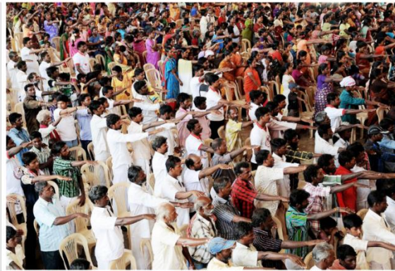
Criminal by 'habit' : Members of various denotified tribes take an oath during the first conference of Inherent People's Rights Organisation in 2012. FILE PHOTO

By this time, States had already started enacting "habitual offender" laws across the country, such as the Madras Restriction of Habitual Offenders Act, 1948, which was extended to Delhi in 1951. Rajasthan passed a similar law in 1953, and over the next two decades more