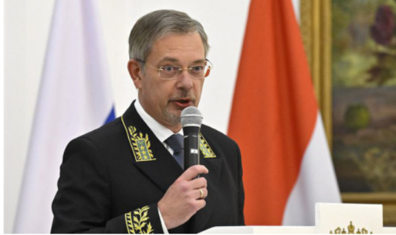
Russian Ambassador to India, Denis Alipov, said 'tensions' had been generated by members of the NATO alliance.

He cited the enhanced tempo of their military activity in the Arctic and attempts by European NATO members to impose their own rules of the game as