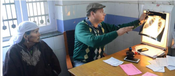
In India, women face challenges such as under-diagnosis and financial barriers while accessing treatment. File photograph used for representational purposes only

A recently published paper titled ‘Women and tuberculosis care in India: a scoping review’ notes that while the variables that impacted women in the past, particularly gender roles and norms, seem to be waning over time, they cannot be ignored in the present. The focus that the government of India is placing on gender equity serves as a reminder that