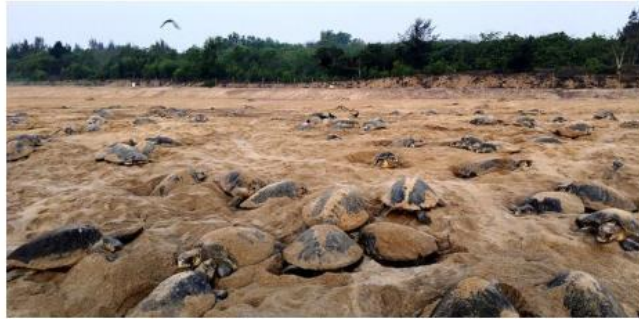
Mass congregation: Olive Ridley turtles are seen at the Rushikulya beach in Ganjam district of Odisha. BISWARANJAN ROUT

“Following the usual pattern, the mass congre-