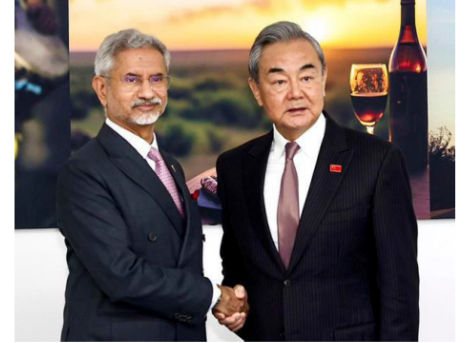
Looking ahead: External Affairs Minister S. Jaishankar with China's Foreign Minister Wang Yi in Johannesburg.

"Such gatherings have provided an opportunity for our interaction even when our ties were going through a difficult phase," Mr. Jaishankar said, in a reference to the bilateral tensions over the deadly Galwan clashes in 2020, and