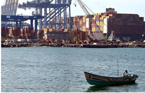
Plans afoot: In the second phase of expansion, Vizhinjam aims to double connectivity and handle more non-liquid cargo. FILE PHOTO

With a natural depth of 18-20 m and proximity to international shipping routes, Vizhinjam is equipped to handle large mother vessels, a critical factor in transshipment efficiency. The port has handled 144 ships and 2.9 lakh containers within six