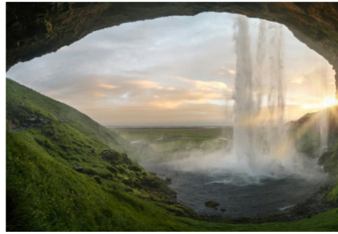
The three most common phases of matter are visible in this image: the solid earth, the liquid water, and a vaporous mist encircling the waterfall.

Because of its size and scope, condensed matter physics has numerous subcategories. For example, the branch of electronic condensed matter is concerned with how electrons behave in solids and liquids. Research on semiconductors would belong here. Likewise, magnetic condensed matter studies different kinds of magnets and magnetism. Soft matter physics studies objects that are easily deformed but not broken, like biological tissue. Nanoscience studies very small objects that can display both classical and quantum properties in the same settings (such work won the Nobel Prize for chemistry in 2023, for example). Superfluidity studies