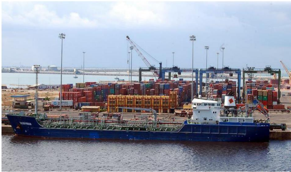
Transshipment hub: Once equipped to handle large vessels, this strategically located port is seen as a worthy rival to Colombo.

Maritime Advisers, in two decades VOC port's container traffic will grow to 2.8-4.3 million TEU from 0.74 million TEU in 2023-24. The port can also convert from feeder to mainline to attract more cargo, including cargo that is currently transhipped at Colombo and other Asian ports, the DPR document says.