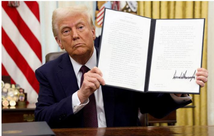
Utter chaos: Mr. Trump has already rattled markets and plunged many national currencies.

The essence of Mr. Trump's economic and trade policies can be summarised as follows: a) cut down the size of his nation's public debt, b) improve his country's trade balance with its major trading partners, c) woo businesses to relocate or to invest in the domestic economy through a policy of carrot and stick, d) make the American economy efficient by reducing its fiscal deficit, which involves cutting the size of its bureaucracy and eliminating unwanted expenditure on international aid, and e)