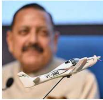
Union Minister Jitendra Singh during the announcement of ToT partner for HANSA-3 (NG).

The HANSA-3 NG aircraft is a two-seater aircraft and is the latest iteration of the HANSA planes that have been made by NAL since 1998. Fourteen HAN-