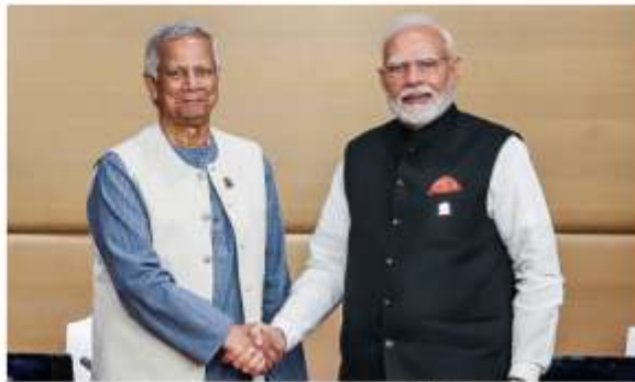
Prime Minister Narendra Modi meets Bangladesh Chief Adviser Muhammad Yunus, in Bangkok on Friday.

While both leaders raised contentious issues – including India's call for the protection of minorities in Bangladesh, Dhaka's demand for the extradition of former Bangladesh PM Sheikh Hasina, and border security issues – during the meeting, they met on cordial terms and exchanged commitments to bilateral ties. Bangladesh will host the BIMSTEC summit next year, and Mr. Modi congratulated Mr. Yu-